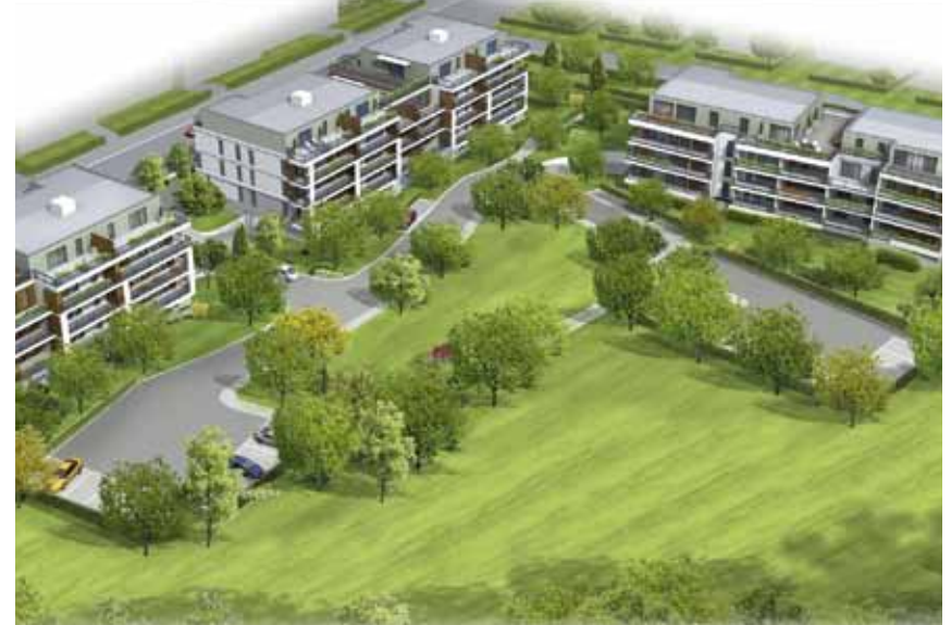
* LES SYMPHORINES *

C'est sur ce lieu chargé d'histoires humaines et naturelles que se dressent les Symphorines.