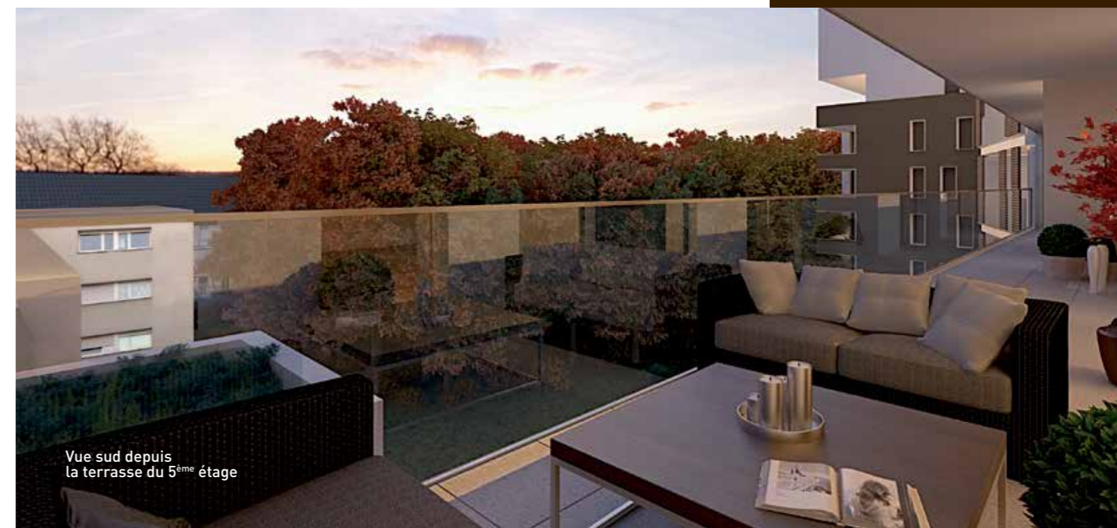
Vue sud depuis la terrasse du 5 ème étage